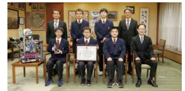
第29回全国高等学校ロボット競技大会埼玉大会 最優秀賞(文部科学大臣賞) 大分県立鶴崎工業高等学校 電気部 競技ロボット班