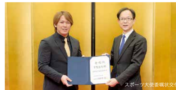
スポーツ大使委嘱状交付