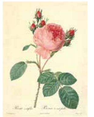
《ロサ・ケンティフォリア》1817年