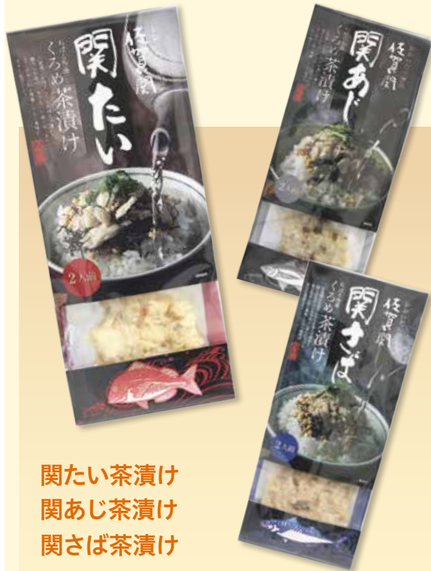
関たい茶漬け 関あじ茶漬け 関さば茶漬け

佐賀県のお母さんたちが手作業で焼いてほぐした「関たい」、「関あじ」、「関さば」の身をふんだんに使用し、佐賀県特産の粘る海藻「くろめ」を加え、関の魚のうまみと「くろめ」の風味が生きた、地元の食材にこだわった贅沢なお茶漬けの素です。