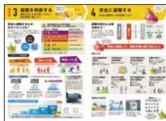
※避難行動イメージ(大分市洪水ハザードマップから)

「わが家の防災マニュアル」および「大分市洪水ハザードマップ」は 市ホームページからダウンロードできます