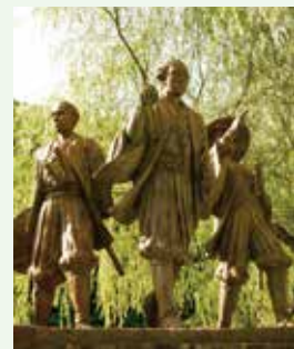
「龍馬脱藩の道（飛翔の像）」

「伊予の小京都」と呼ばれる大洲市は、四方を豊かな自然に囲まれた歴史と文化の薫るまちです。市内中心部には、平成16(2004)年に木造で復元された四層四階の天守をもつ「大洲城」と周囲に残る町並みがあり城下町の歴史を感じさせてくれます。