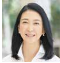
紺野 美沙子 氏

10月27日から11月9日の「秋の読書週間」に合わせて、文化講演会を開催します。講師は紺野美沙子氏(俳優・朗読座主宰)で講演と国際親善活動などについての対談との二部構成で行います。定員は150人で、先着順。入場は無料ですが、入場整理券が必要です。入場整理券は、10月15日(木)から市民図書館2階中央カウンター、市民図書館コンパルホール分館カウンター、各地区公民館図書室、鶴崎・植田市民行政センター図書室にて配布します。なお、配布場所により枚数に限りがあります。