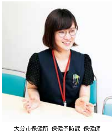
大分市保健所 保健予防課 保健師

発熱など風邪のような症状が見られるときは、学校や会社を休み、外出を控え、毎日体温を測り記録してください。すぐにでも病院に行きたいと思う人は多いでしょうが、まずはかかりつけ医、または近隣の医療機関に電話で症状を伝え、受診方法の指示に従いましょう。また、複数の医療機関を受診することにより感染が拡大した例がありますの