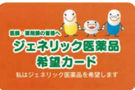
ジェネリック医薬品希望カード