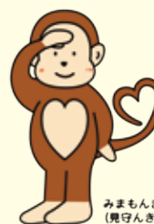
みまもんきー(機守もんきー)

実施日:第2・3・4火曜日(祝日、年末年始を除く) 時間:午後1時～4時 場所:保健所内 ※事前予約が必要です。