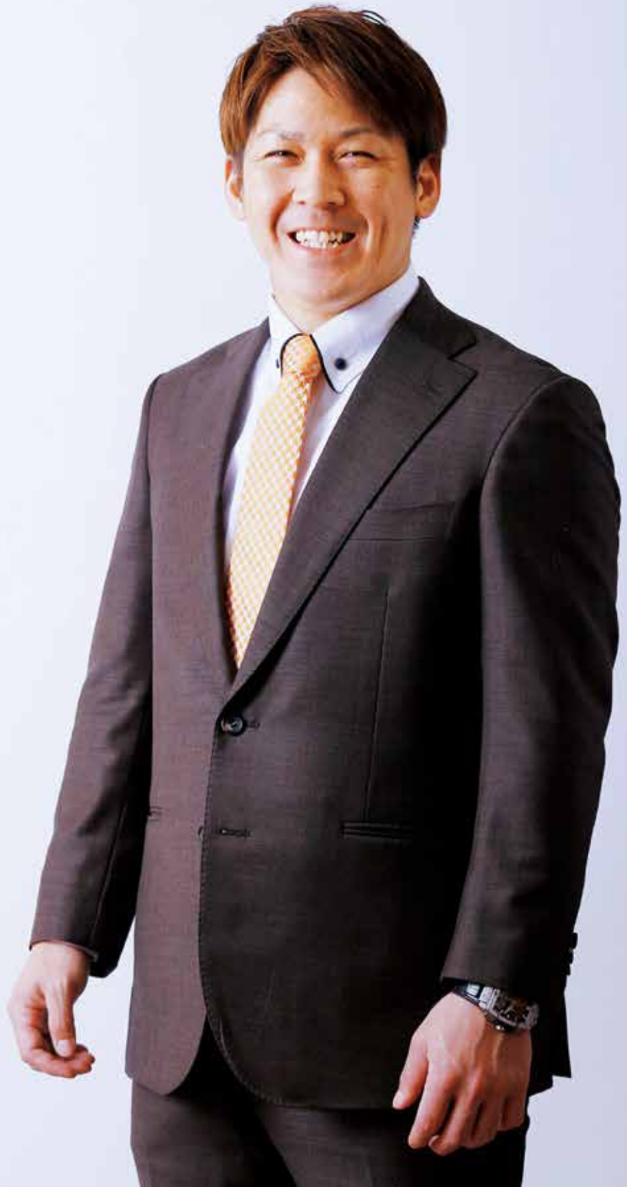
福岡ソフトバンクホークス 甲斐拓也 選手