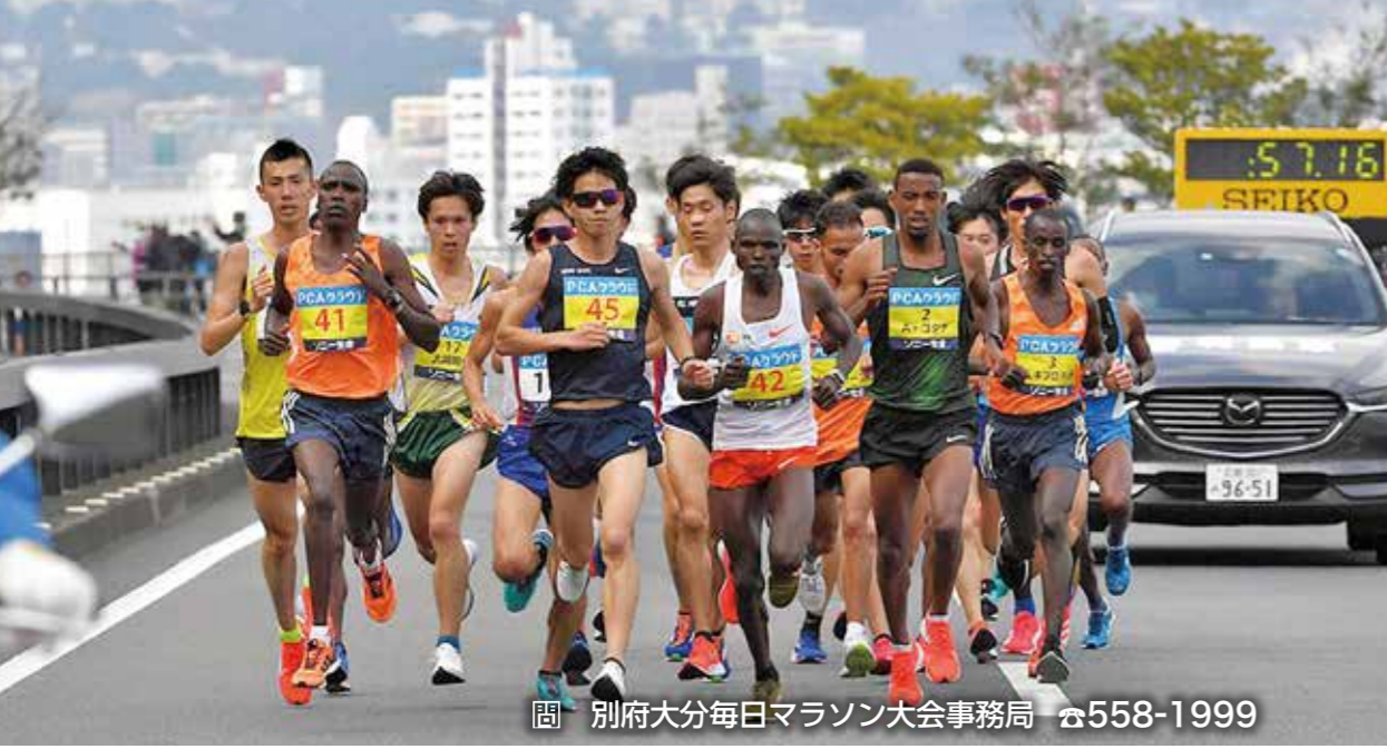
別府大分毎日マラソン大会事務局 ☎558-1999