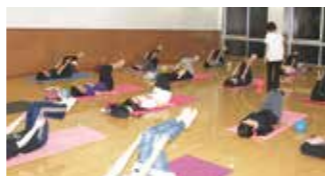
ピラティス講座の様子

市立エスペランサ・コレジオは、資格取得を目指す人や趣味を深めたい人の学習をサポートします。対象は、市内に居住・通勤している満15歳以上39歳以下の人（定員に満たない場合は49歳以下の人まで）です。申込みは、エスペランサ・コレジオに直接お越しください。定員に満たないコースは、追加募集を3月4日(水)から受け付けます。詳しくは、お問い合わせください。