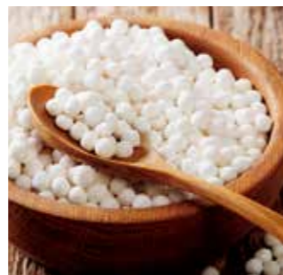
タピオカ(キャッサバが原料)