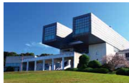
北九州市立美術館 (1974)