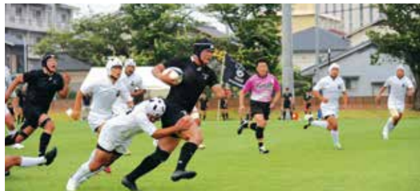
6月8日に駄原総合運動公園球技場で開催した天理高校と大分舞鶴高校の交流試合の様子

1984年1月7日、「全国高等学校ラグビーフットボール大会」の決勝、天理高校と大分舞鶴高校の試合は、高校ラグビー史に残る名勝負といわれています。歌手のMay J.さんが英語で歌う松任谷由実さん作詞・作曲の「NO SIDE」にのせて、「大分ラグビーメモリアル」の動画を作成しました。これを見て、大分ラグビーの魅力を感じてみませんか。