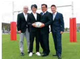
名勝負を繰り上げた両校のOB