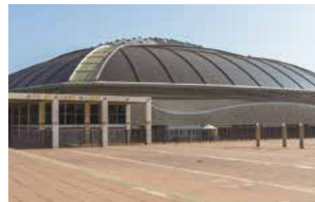
サン・ジョルディ・スポーツ・パルス (1990) 奈義町現代美術館 (1994)

実際に建築された建物は、いずれ壊れます。30年も経てば耐震補強が必要になったり、耐震の基準そのものが変わるなど、建てた当初の姿には確実に寿命があります。建物よりも寿命が長いのは図面や模型。建物よりも建築模型の寿命の方が長いのです。そして、究極を言えば優れた「コンセプト」には寿命はない、ということ。それが磯崎さんにとってのアンビルトの本質なのです。