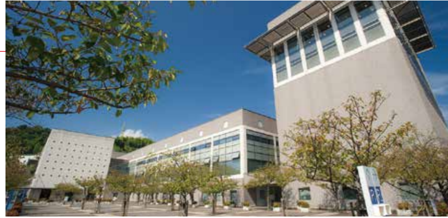
豊の国情報ライブラリー (1995)