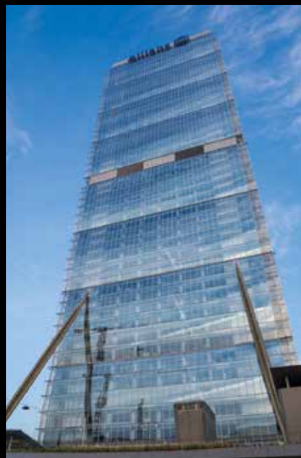
シティライフ・アリアンツ・タワー (2015) 2015ミラノ万博の際に建設され、現在は保険会社の持ちビルとなっている