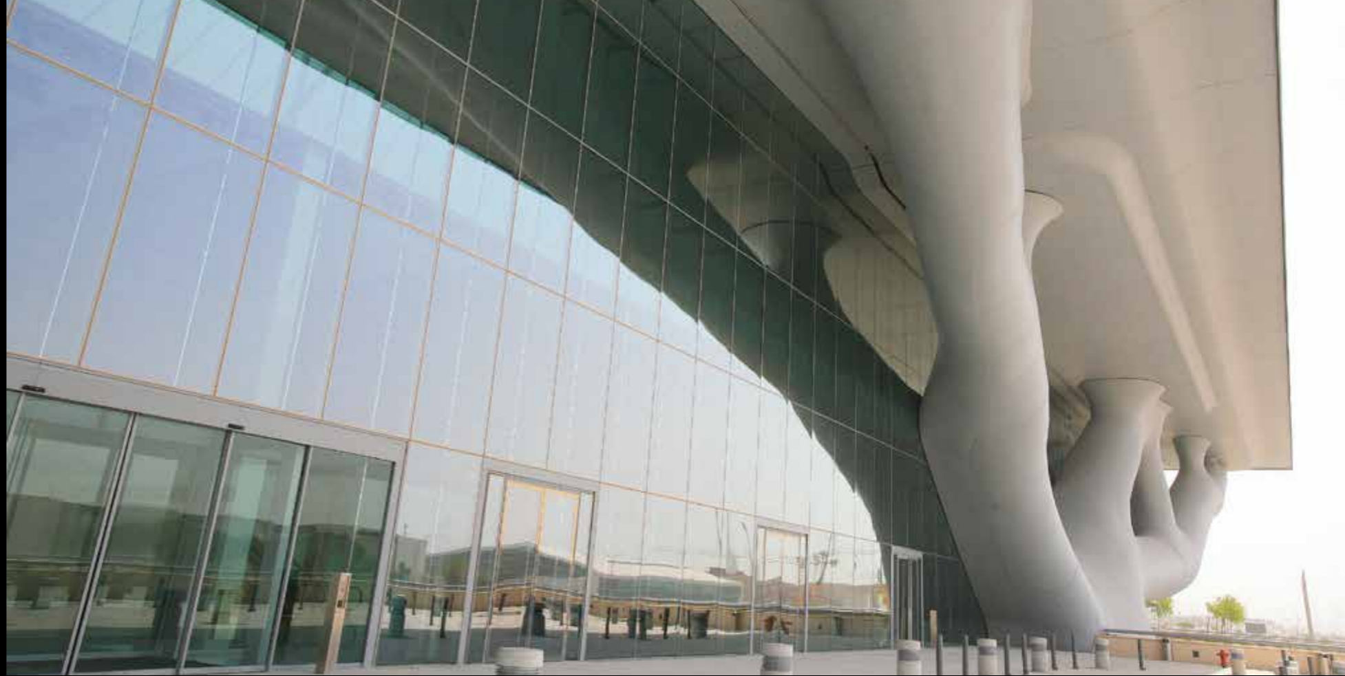
カタール国立コンベンションセンター (2011) 各種会議場と劇場を内包し、最先端の技術で多様なイベントに対応可能な複合施設