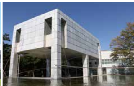
群馬県立近代美術館 (1974)