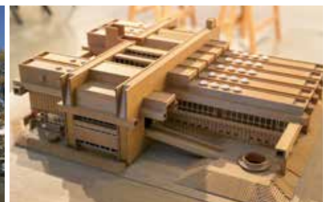
大分県立大分図書館(現アートプラザ) (1966)