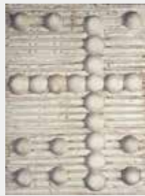
吉村益信《殺打駄氏の塔(幽閉されたハレム)》1961

本展では、磯崎と関わりの深い大分市ゆかりの吉村、赤瀬川、風倉などの作品を紹介しています。