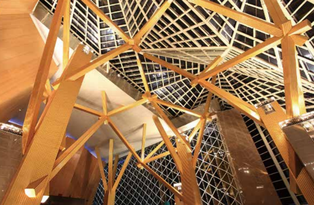
深圳文化中心 (2007) 図書館とコンサートホールを複合した文化施設