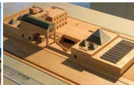
ロサンゼルス現代美術館 (1986)