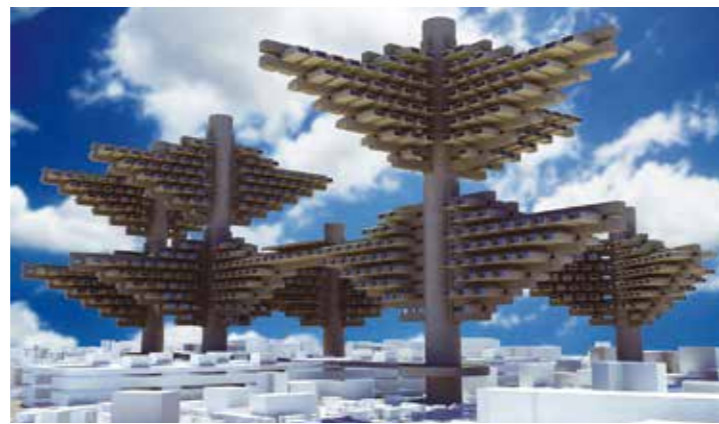
「空中都市-渋谷計画」2011年CG映像 制作：芝浦工業大学八東はじめ研究室・菊池誠研究室、デジタルハリウッド大学院メタボリズム展示プロジェクト、森美術館

大分に帰省する途中にしばしば立ち寄った東大寺南大門。この断面を10倍にしたら未来都市があらわれた