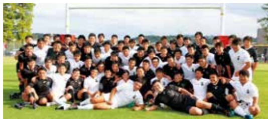
試合後の集合写真