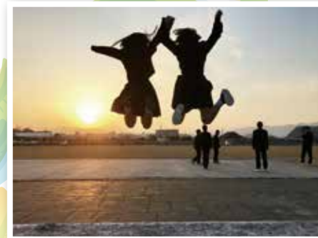
2018人権フォトコンテスト入選作品『未来へ。』

インターネットで笑顔になったり不安を感じた瞬間や、どんなに便利な世の中になっても忘れてはいけない「人と人とのつながり」など、人権の大切さを感じる場面を一枚の写真にしてみませんか。