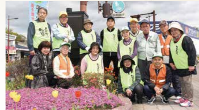
顕徳町老人会デウスクラブ (顕徳町)

永年にわたり、地区内の清掃活動をはじめ、国道の植栽帯の維持管理などに献身的に取り組み、快適で住みよい地域社会づくりに貢献されました。