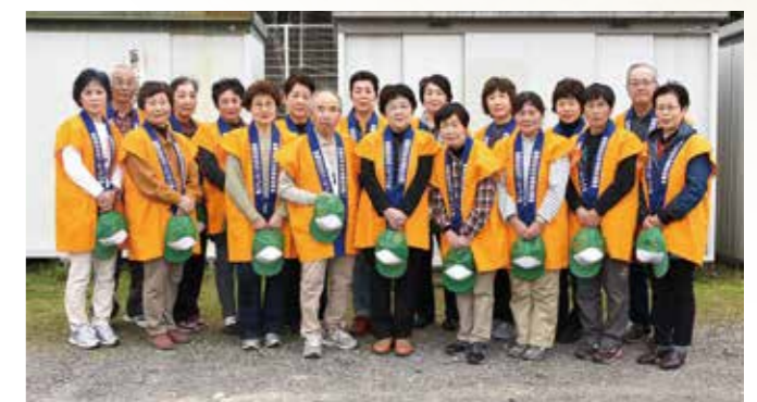
東植田校区ボランティアの会 (東植田)

永年にわたり、福祉施設等への慰問活動に献身的に取り組み、明るく住みよい地域社会づくりに貢献されました。