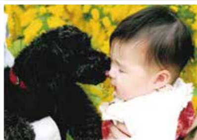
第32回 愛犬・愛猫との写真コンテスト 金賞