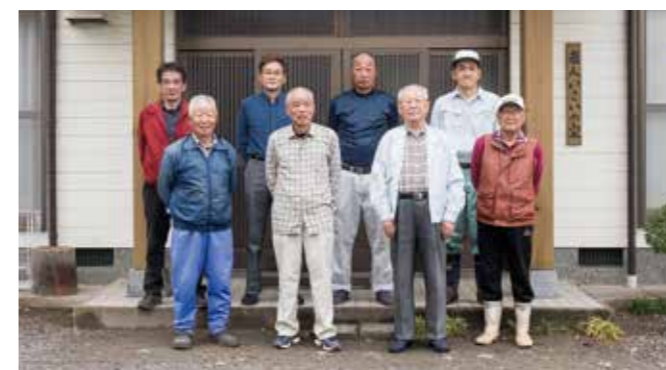
口戸頼母子会 (植田)

永年にわたり、福祉施設等への慰問活動に献身的に取り組み、明るく住みよい地域社会づくりに貢献されました。