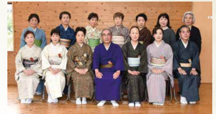
中山民俗舞踊芳扇会 (鷺野)

永年にわたり、福祉施設等への慰問活動に献身的に取り組み、明るく住みよい地域社会づくりに貢献されました。