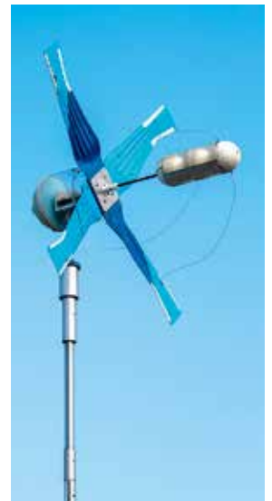
大学内では、『マイクロ・エコ風車』が回っている様子を見ることができる。