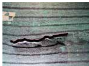
回流式可視化水槽では、羽根の周りの空気の流れを確認できる。