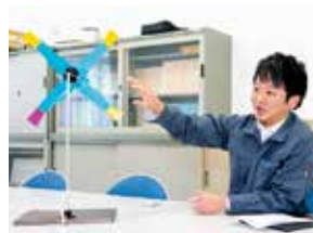
風車の大きさは、50cmから1m程度と簡単に持ち運びができるほど小型。

誉教授が生み出した技術。しっかりと引き継いで実現させたいと思います」と意気込みを語っていました。大分生まれのエコ風車が、災害や人手不足の農業の救世主になる日も近いかもしれません。