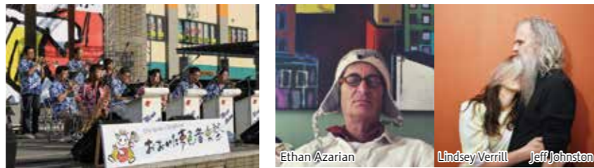
みゅーじふる・たうん