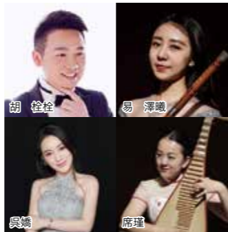
武漢市ミュージシャン

時間：午後5時～8時 スペシャルゲストにシンガーソングライターの井上苑子さんが登場!さらに友好都市・中国武漢市、姉妹都市・アメリカテキサス州オースチン市からミュージシャンが出演します。