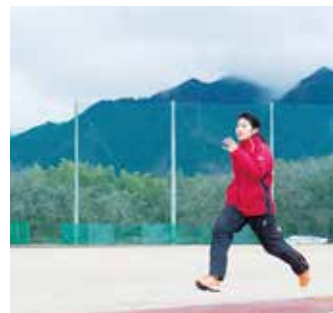
▲100m走の自己ベストは11秒76