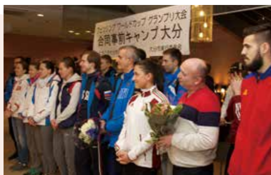
2016年3月 8カ国が参加した合同合宿の歓迎会