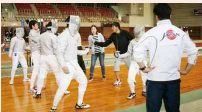
2017年3月 日本代表の選手によるフェンシング教室(県立総合体育館)