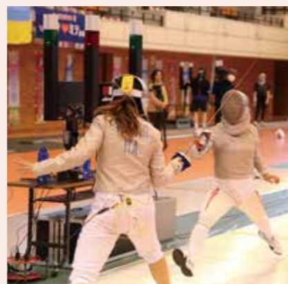
2017年3月 4カ国が参加した女子合同合宿（コンパルホール）