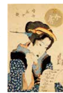
溪斎英泉 「時世美女鏡 女房」