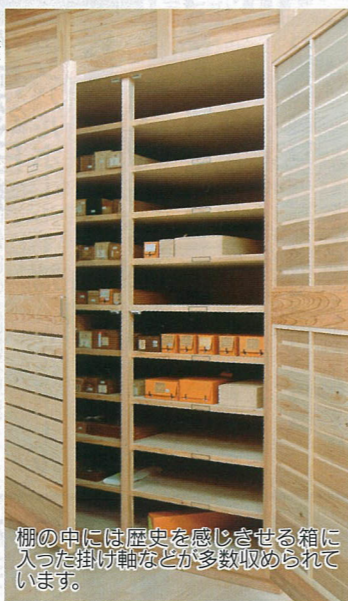
棚の中には歴史を感じさせる箱に入った掛け軸などが多数収められています。