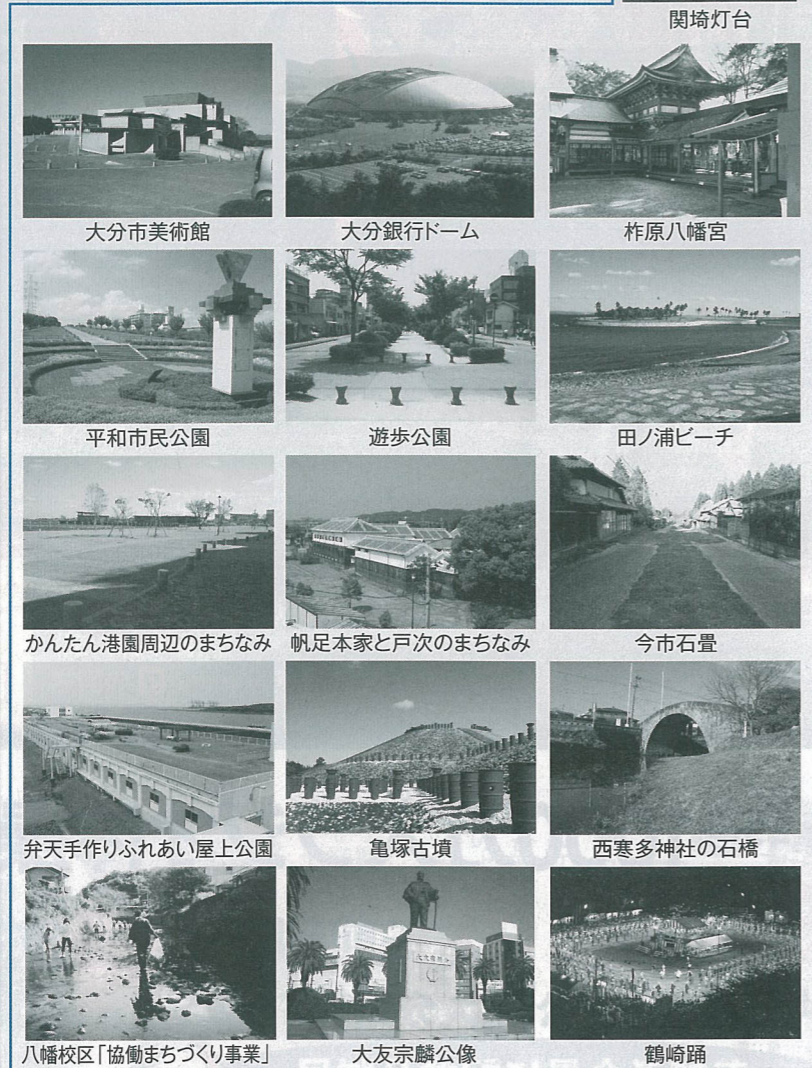
おおいた景観モデル賞(建築物・工作物・まちづくり部門)16点

20年度「おおいた景観発見賞」12点と21年度「おおいた景観モデル賞」16点から、「おおいた景観大賞」1点および「おおいた景観望賞(写真部門)」3点、「おおいた景観奨励賞(建築物・工作物・まちづくり部門)」3点を選考します。 市民の皆さんの投票結果の上位点数を選考委員会に推薦します。大賞および各部門賞は、23年1月下旬に開催する選考委員会で決定する予定です。