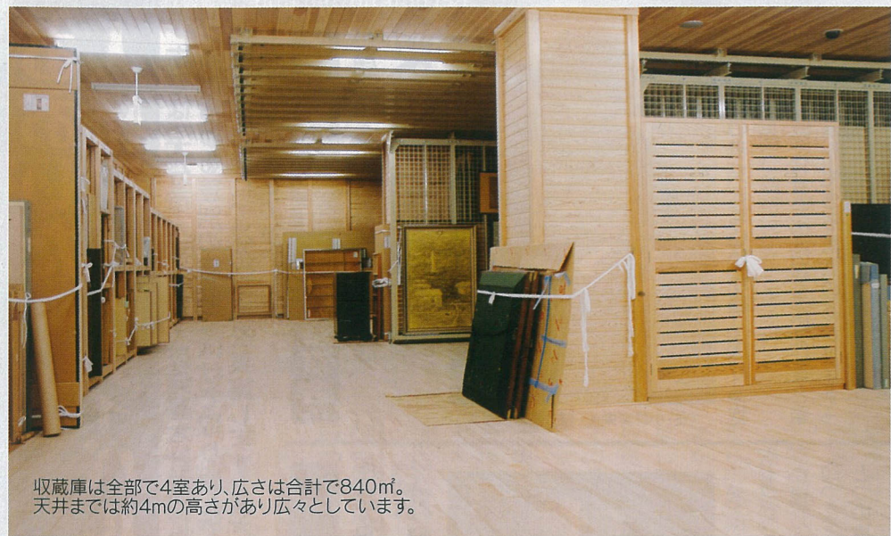
収蔵庫は全部で4室あり、広さは合計で840㎡。天井までは約4mの高さがあり広々としています。

美術館では、常設展でこれらの所蔵品を年4回の展示替えて、計画的に展示しています。また、特別展開催中は特別展の観覧料で観覧できますので、ぜひ、美術館を訪れて、いやしのときを過ごしてみませんか。