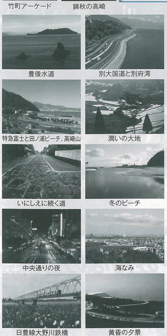
おおいた景観発見賞(写真部門)12点