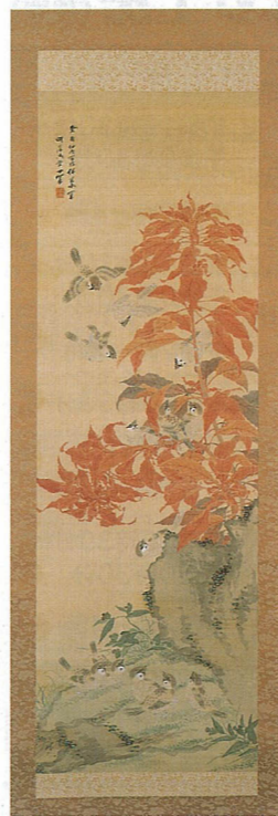
田能村竹田 「雁来紅群雀図」 (20年度に修復)