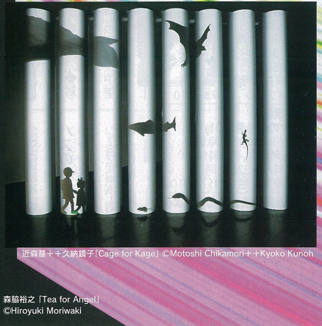
近森基十+久納鏡子「Cage for Kage」©Motoshi Chikamori+Kyoko Kunoh