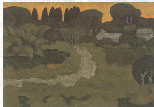
高山辰雄 「暮小径」 (21年度の収集作品)