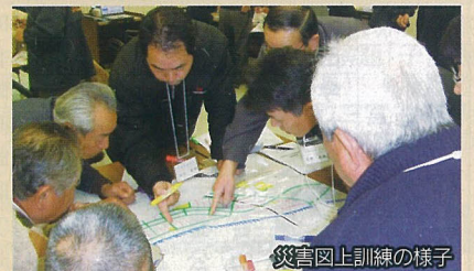
災害図上訓練の様子

そこで、19年から大分市との連携を図り、自主防災組織の結成支援、その活動の中核をなす防災士への実践研修、自治会向けの防災講話、防災訓練の支援、災害図上訓練、防災資機材の備蓄指導など幅広い活動を行っています。