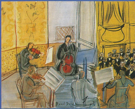
「五重奏」1948年頃 ポーラ美術館蔵