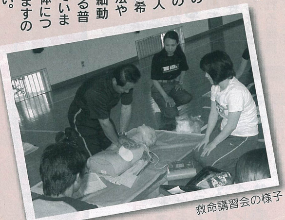
救命講習会の様子

消防局では、毎月9のつく日(土日曜日、祝日の場合は次の平日)に、個人および9人以下での受講希望者に対して、心肺蘇生法やAED(自動体外式除細動器)の使用方法を指導する普通救命講習会を開催しています。また、10人以上の団体については、指導員が出向しますので、ぜひ受講してください。