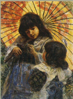
青木繁「二人の少女」1909

ヤンマーディーゼル創業者の山岡孫吉(1888~1962)のコレクションを中心に、約170点の作品で、日本近代洋画の歩みを紹介します。