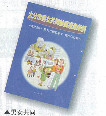
▲男女共同参画推進条例のパンフレット

それぞれ掲げ、市民の皆さんと行政が協働して男女共同参画社会の実現を進めることにしています。さらに、15項目にわたって計画達成のための指標を設けていることも特徴の一つです。