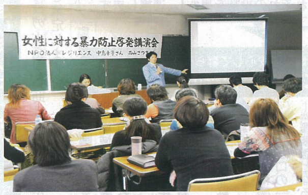
▲女性に対する暴力防止啓発講演会

少子高齢化の進行や女性の社会進出など社会情勢が著しく変化する中、市では、性別にかかわらず個性や能力を発揮できる男女共同参画社会を実現するため、「大分市男女共同参画推進条例」(18年10月)を施行しました。今回、条例の理念をさらに具体化するため、これまでの取り組みを見直し、「第2次おおいた男女共同参画推進プラン」を今年の3月に策定しました。今回のプランでは、女性に対するあらゆる暴力の根絶をはじめ、5つの重点項目を設けています。また、市の取り組みだけでなく、市民や事業者の取り組みを