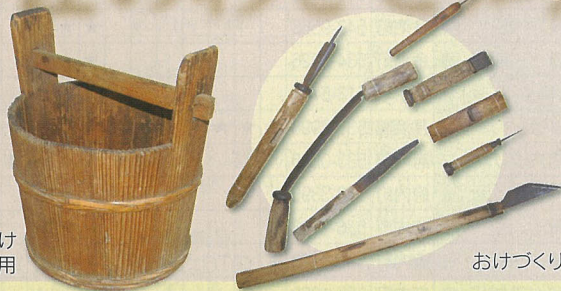
おけづくりの道具

今回の展示では、一つの道具が完成するまでに必要とされる、多くの道具とその中にみる匠のわざと知恵をご紹介します。水をくむためのおけ 1864年ごろ使用