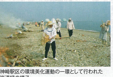
本神崎駅区の環境美化運動の一環として行われた海岸清掃の様子

催し、「安心安全のまちづくり」や「世代間交流事業」など10自治会の事例を紹介してもらいました。その後のパネルディスカッションでも活発な意見交換が行われ、参加者は各自治会の取り組みについての情報を共有できたようでした。市では、こうした取り組みを通して多くの人に住民主体のまちづくりに関心を持ってもらい、今後の地域コミュニティの更なる活性化につなげていきたいと考えています。