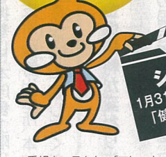
番組キャラクター「フレッシュ」