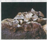
カゴ入りの黒曜石