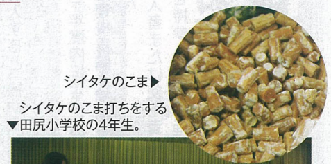
シタケのこま ▶ シタケのこま打ちをする▼田尻小学校の4年生。

あけ・こま打ち・伏せ込みまでのシタケづくりの一連の作業を体験しました。はじめての体験に、児童たちは一生懸命取り組み、「どのくらいまで大きくなるの」「1本からどれくらいとれるの」というシタケに関する質問から、割りばしの使用が森林に与える影響についての質問なども出され、子どもたちの森林への関心は深まったようでした。市では森のしくみや大切さについて広く理解してもらうよう今後も体験事業を進めていきます。