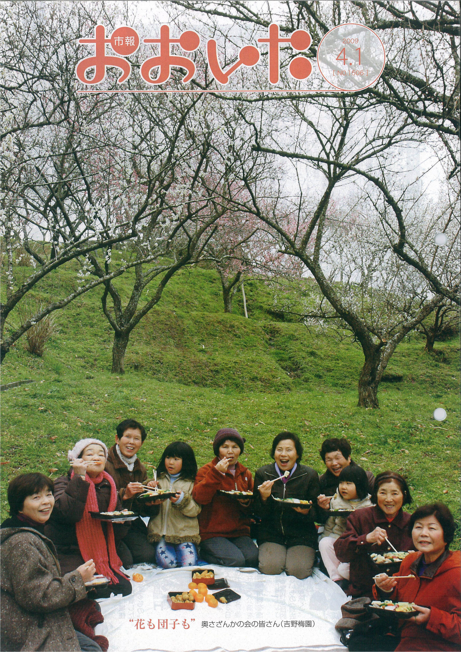
“花も団子も” 奥さんかの会の皆さん(吉野梅園)