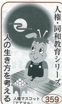
人権・同和教育シリーズ 人の生き方を考える 359 人権マスコット「ててマル」

間は「ずれにしろ」と言わんばかりに無視し始めたのです。翌朝、わたしは彼が誘いに来る前に家を出ました。彼と親しくするとわたしまで仲間はずれにされると思っていたからです。後から登校してきた彼は、さすがに目でもわたしを見ていました。その視線を振り払うように無視しました。一日中だれ一人として彼に話しかける人はいませんでした。肩を落として下校している彼の姿を見て話しかけようとしたが、周りの目が気になりできませんでした。この日を最後に彼は学校に来なくなり、数日後、転校したことを先生から聞いたのです。 仲間と別れて家に帰ってからも彼のことが頭から離れませんでした。謝れるものなら今すぐにでも謝りたいと思っているのですが、どうしようもないのです。 (ある男性の話より) 人権侵害は、された人の心に傷を残すだけでなく、した人の心も深く傷つけます。周りの人に合わせるのではなく、自分自身が相手を見つめ、判断し、行動することが大切ではないでしょうか。