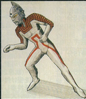
成田亨「ウルトラセブン決定稿B案」 青森県立美術館蔵 ©Ruri Narita