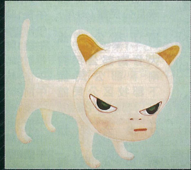
奈良美智「White Rior」 青森県立美術館蔵 ©Yoshitomo Nara