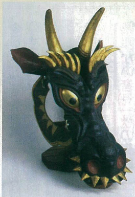
馬面(大阪城天守閣)