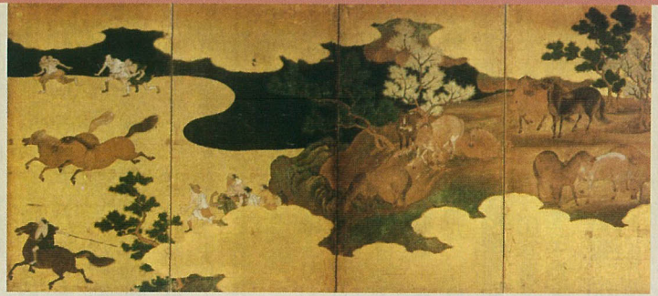
牧馬図屏風(部分) 江戸時代 馬の博物館

この展覧会では、県内に伝わる馬に関する作品や資料を交えながら、馬と日本人の多様なつきあいの歴史を紹介します。