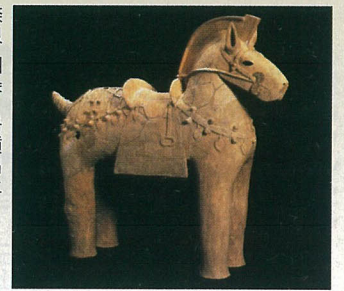
奈良・四条1号墳出土 埴輪飾り馬 (奈良県立橿原考古学研究所)