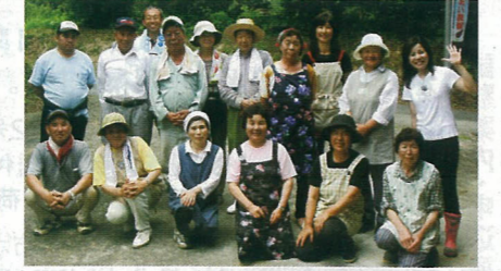
「上志津留を楽しむ会」の皆さん

いま自分たちにはできることは何か…。 まさに、足下にある大地をしっかりと見つめて、楽しみながら一步一步あるく「上志津留を楽しむ会」の皆さんの表情には、まぶしいほどの希望の色が、差し込んでいるように見えました。