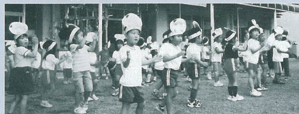
園児によるめじろんダンス