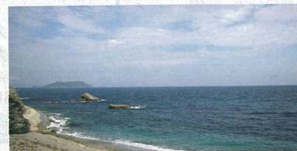
いったい彼に何が起ったのか? 聞いてみると「先日、おはらいに行つて

“天気”といえば、「フレッシュおおいた」のロケは、ここ数年ほとんど雨に降られたことがない。しかし、今年度から新たに変わったスタッフが、自他共に認める雨男…いや、雨男というより“嵐を呼ぶ男”。撮影スタッフ全員が、彼に無言のプレッシャーを与えつつ“雨”という予報が出ている撮影当日を迎えた。 しかし、雨はあがり、なんと青空になってしまった。