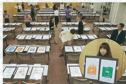
〈ごみ袋デザイン公開風景と最優秀作品〉

また、ごみ袋の作品展を8月22日(金)から24日(日)までガレリア竹町で開催しますので、ぜひお越しください。