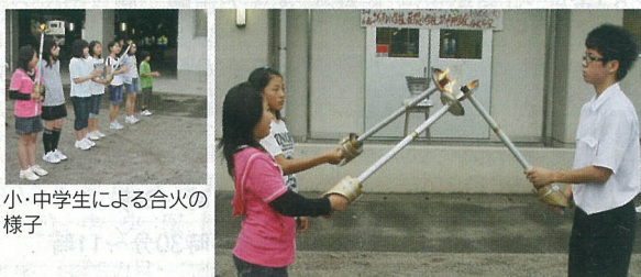
小・中学生による合火の様子