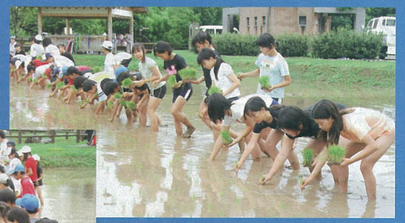
七瀬川自然公園田植え体験学習 6月20日(金) 七瀬川自然公園 水田植田小学校5年生が田植えを体験。泥だらけになりながら、一生懸命に苗を植えていました。