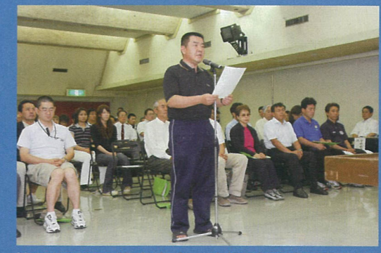
第61回県民体育大会 市選手団結団壮行式 6月20日(金) 大分文化会館 県体に出場する市代表の選手や関係者が一堂に会し、総合優勝に向けて団結式が行われました。