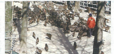
▲サツマイモに群がるサルたち

午後1時、サルたちの鳴き声が興奮度を増し、それまで30分おきにまかれていた小麦に替わり、ご馳走のサツマイモが一気にばらまかれた。