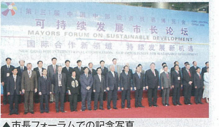
▲市長フォーラムでの記念写真