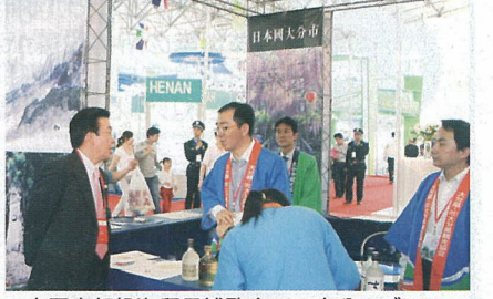
▲中国中部投資貿易博覧会での大分のブース