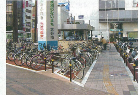
大分駅前東駐輪場