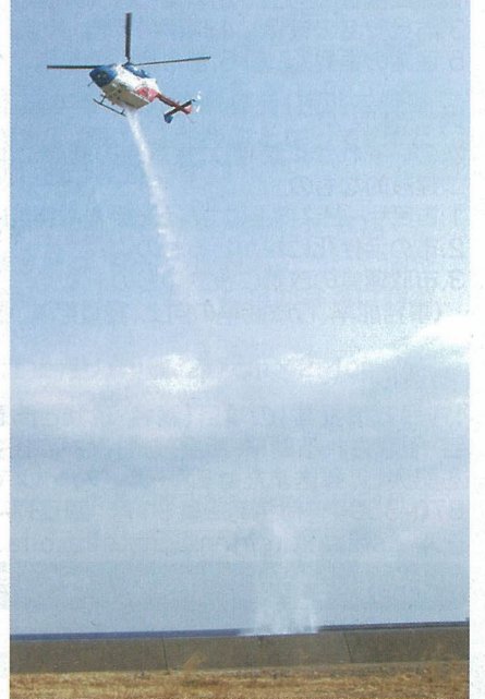
上空からの放水訓練

携を図りながら、消火技術や指揮能力を向上させ、林野火災防御に万全の態勢で臨むことにしています。