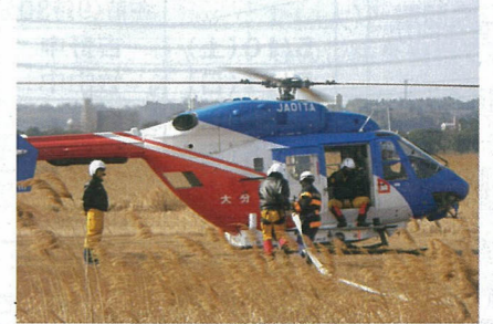
消防車からヘリコプターへ補水

林野火災防御訓練 3月1日から7日は「春の火災予防運動」実施期間です。この時期は空気が乾燥し、林野火災が発生しやすくなるため、3月4日・5日に、青崎の6号地で東消防署と県防災航空隊による林野火災防御訓練が実施されました。