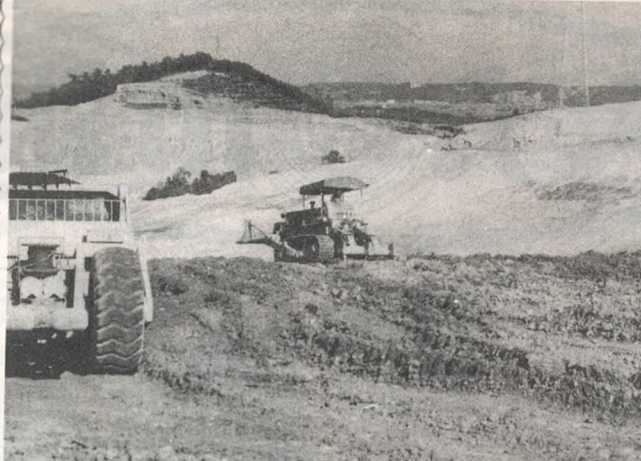
(造成事業のすすむ報徳農場)

市内、滝尾地区下部の高低い山中を切り開き、現在、大規模なみかん園の造成がすすまれている。