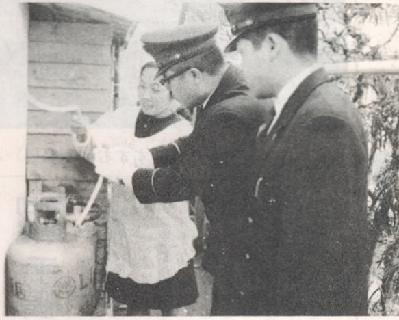
〈家庭の防火診断を行なう消防職員〉

火災の多発期を迎え、十一月二十六日から十二月二日まで全国一斉に秋の火災予防運動が行なわれます。 今年はこの三点を中心に防火運動を行なうことにしました。 ①わが家の防火点検 ②たばこの投捨てと寝たばこの防止 ③暖房器具の正しい使い方