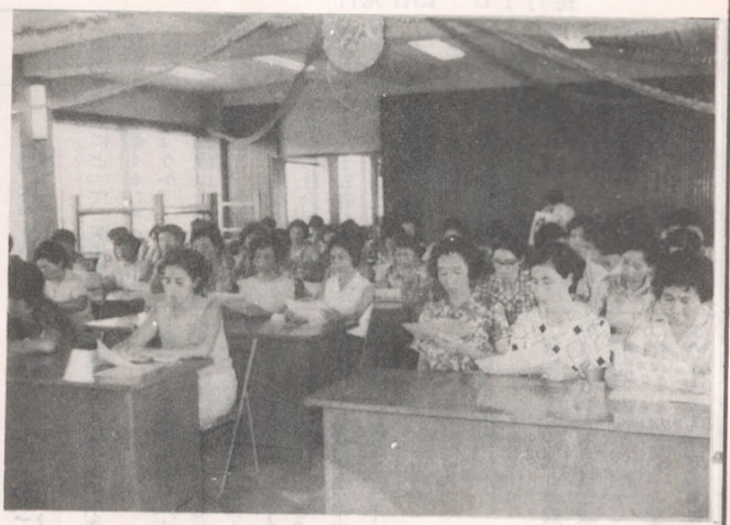
第3回消費生活教室 (坂ノ市地区)

商店街を歩いていると多種多様な商品が目につきます。一つの商品を買おうとしても、思わず「あれを買おうか」と迷うこともあります。 また消費者物価は、ますます上昇の一途をたどっています。このような商品の氾濫や消費者物価の上昇から、市民の消費生活を保護することも、適切な消費生活の指導を行なうことも消費者保護行政を本年度の市政の重点施策にとりあげていきたいと思います。今回はその概要をお知らせしましょう。