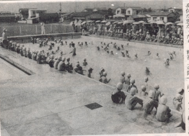
完成した南大分小学校のプール