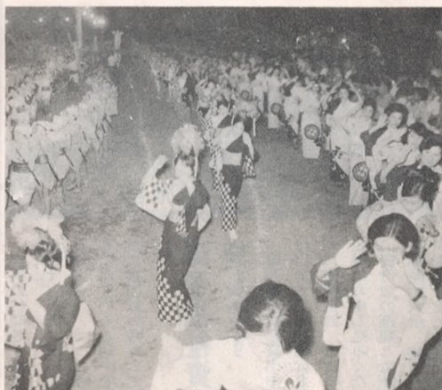
夏の夜の風物詩「鶴崎おどり」(昨年の写真)

すつかり全国的にも知られた「鶴崎おどり」が、ことしも八月二十二日、二十三日の両日午後七時半から十時まで鶴崎グラウンドで開かれます。