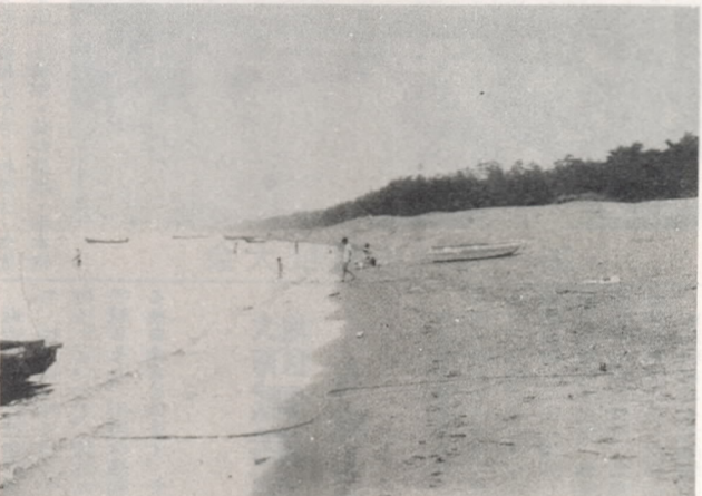
6号埋立地となる大在海岸

第二期計画では、大在地区から佐賀町中の原地区にいたる約十キロメートルの海岸部に工場用地を造成し、背後地の整備を行ないます。 埋立地造成は一号地を拡張して約二百十ヘクタールの工場用地を造成します。