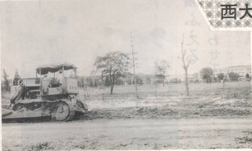
大学跡地の整地工事

市では、地元の協力を得て、今年度から「西大分土地整理事業」をはじめました。これは交通のネットワークを解消し、安全で住みよいまちづくりのためにすすめられているものです。今年度は、四億二千七百五十万円で次の事業をすすめています。