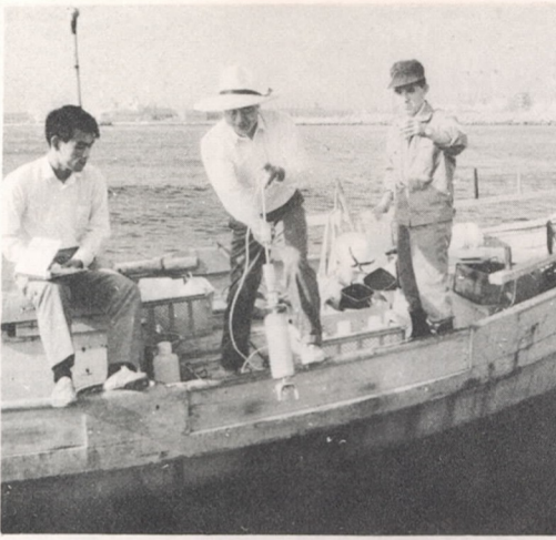
河口で採水を行なう調査班

市は工場廃液などによる河川や海水の汚濁の実態を調べるため、七月十五日、第一回の水質検査を行いました。 陸・海の二班に別れた職員のうち陸上班は、五号地―大洲園―大分製紙―東芝―原川下水処理場―三善製紙―鶴崎バルブ等の排水口附近の水質を調査したり採水を行いました。