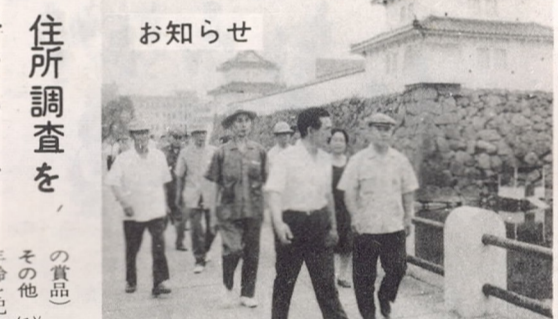
大分市民歩こう会

第1回市民歩こう会が7月12日城址公園で開かれました。足元がぬかるんでおりましたが、参加者は健康増進のため、積極的に歩きました。市教育委員会の指導のもと、市民の健康増進に努めています。