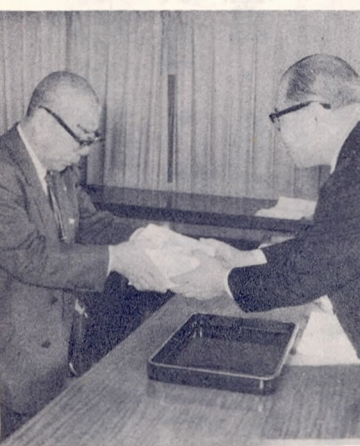
写真＝各施設代表者に金手渡される

地方税法により、事業用に使われる償却資産の所有者は、毎年一月三十一日までに、事業用償却資産についての申告を市長あてにしなければなりません。申告の内容は一月一日現在の事業用償却資産の所在、種類、数量、取得時期、取得価額、耐用年数、見積価格、その他償却資産課税台帳の登録、およびその償却資産の価格に必要な事項となっております。