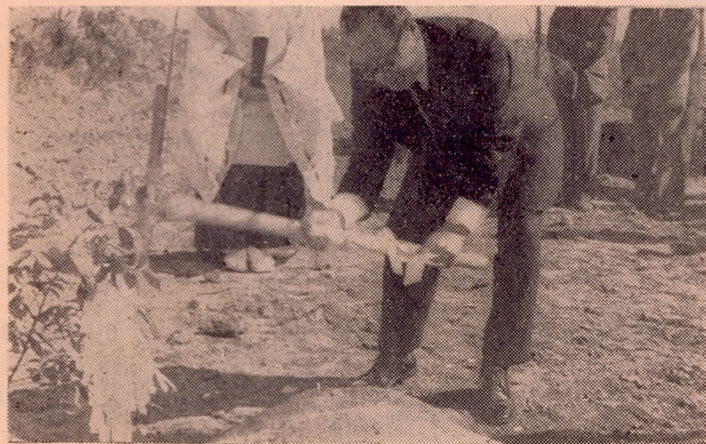
写真一下水処理場の起工式でくわ入れする市長