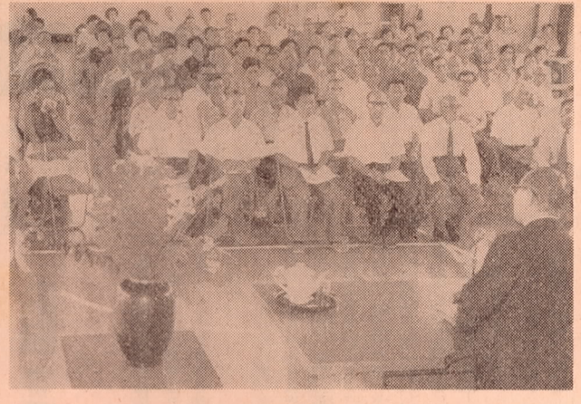
写真=賀来中学校体育館で開かれた市政懇談会

今年春から「市長と市民との対話」をめぐり、九月四日午後二時から、坂ノ市地区で「市長と市民との対話」をめぐり、九月四日午後二時から、坂ノ市地区で「市長と市民との対話」を開催しました。