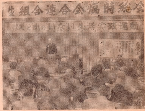
総合タイム協会 大分市衛生組合連合会臨時総会

実施するが、衛生組合は各地区の家屋内外を実施する。④はえやかの多発生場所の駆除実践指導 ⑤環境整備運動 ⑥協力団体の活動促進