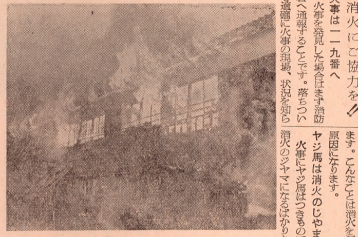
こんな火災にならないように注意しよう

火災のおこすやすいときです。昨年中発生した火事は、全部で百四十九件、そのうち半分近くの六十三件が一月、二月におこっています。これから春にかけて火災の発生しやすい時期がはじまります。この火災多発期に備え今年はこのことを一般の事象目標として