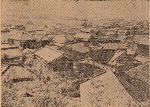
高台から見下した三ヶ田町

南大分三万田町は組数十一組二非帯に便利であるといつてから○世帯の町で、昭和十五年には同公園の横に六十三坪の土地を南大分三万田町商店会を結成し南立金十万円で購入した。その大分第一の商店街として発展してしまつた。ところが同地区には他の地区に見るようなお寺や集会所がないため、子供たちの会合を開くことができず、町内の子供たちの親睦会や、又町内の集會にもとくありませんでした。