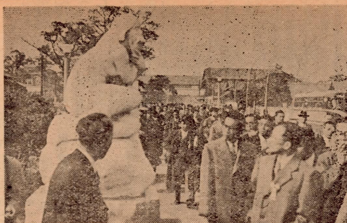
去る四月九日より三日間に亘り、名が出席し第一日は開会式に引続

近郊の諸園を巡り、ここに三日間に及ぶ日程を無事終了し、多大の収穫を納めて盛會に且つ