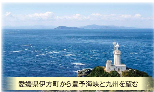
愛媛県伊方町から豊予海峡と九州を望む