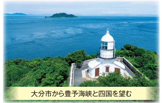
大分市から豊予海峡と四国を望む

大分市では、豊予海峡ルートの整備によってもたらされる経済・社会効果の調査や、豊予海峡ルートに関する有識者の意見をまとめた論集の作成など、さまざまな取組を進めています。