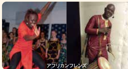
アフリカンフレンズ