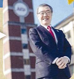
立命館アジア太平洋大学(APU)学長 出口 治明

こんにちは。立命館アジア太平洋大学(APU)学長の出口治明です。皆さんは、APUに対してどのような印象をお持ちですか。僕は、APUは「若者の国連」だと思っています。約90の国と地域から3000人の留学生が集まり、共に学び・高め合っているからです。この様な環境の大学は他にはありません。「Oita Global Station」で繰り広げられる学生の催し物を通じて、少しでもAPUのグローバルな息吹を感じてもらえると嬉しいです。